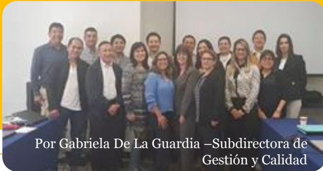
Por Gabriela De La Guardia –Subdirectora de Gestión y Calidad