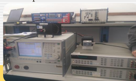
Sistema para calibrar fuentes generadoras de armónicos.

La medición de armónicos en nuestras redes eléctricas resulta de alta importancia ya que repercute directamente en pérdidas económicas e influye en la calidad de la potencia que recibimos en nuestros hogares. A través del taller se adquirió información técnica indispensable para preparar una propuesta que involucre el equipamiento y formación del personal, para establecer el servicio de calibración de armónicos en el CENAMEP AIP en los próximos años.